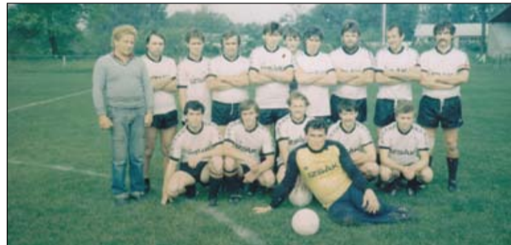
Régi idők izsáki focija - a '80-as évek megyei kettőben játszó együttese

Csengődön játszott, s 1980-ban került Izsákra. Itt mintegy két évtizeden át, 1998-ig játszott a megyei első osztályban szereplő csapatunkban. Volt egy időszaka, amikor Orgoványra is átrándult, az ottani megyei