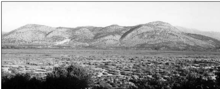
A fülemülesítkéket fontos telelőterülete nyugat Görögországban

szeptember végén hagyják el a Kárpát-medencét, de vonulásuk még sokáig elhúzódik. Az utolsó madarak csak november elején vonulnak el Magyarországról. Az állomány nagy része azonban már október végén eléri az adriai és a jón tenger partvidékét.