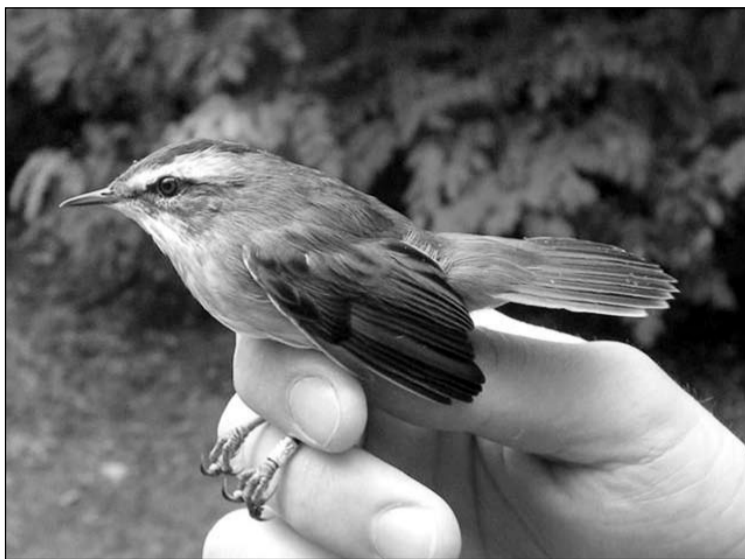
Fülemülesítke ( Acrocephalus melanopogon )

Erről az apró, mindössze 10 gramm tömegű, barnás színezetű madárról a magyar iskolások közül minden bizonnyal az izsáki gyerekek tudnak a legtöbbet. Köszönhető ez annak, hogy iskolánk nagy hangsúlyt fektet arra, hogy a tanulók minél többet megtudjanak Izsák hatalmas természeti kincséről, a Kolon-tóról. Így hát a gyerekek, mire elballagnak, már kívülről