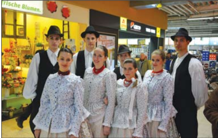
Fellépés a kézműves vásáron

A gasztrokulturális esemény a kecskeméti Garabó közreműködésével került megrendezésre. A tizennyolcezer lelket számláló kisváros történelmi központjában Izsák várost a