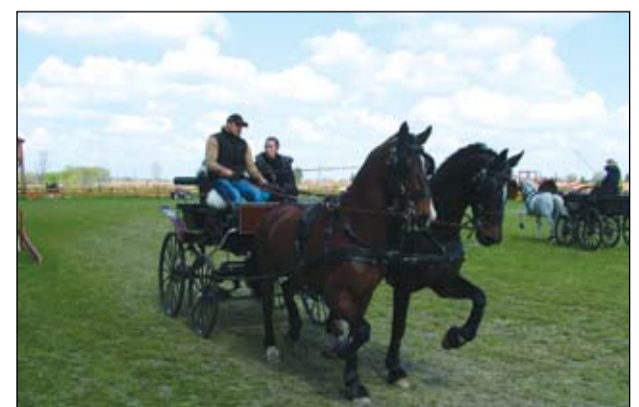
Bakon az ifjúság