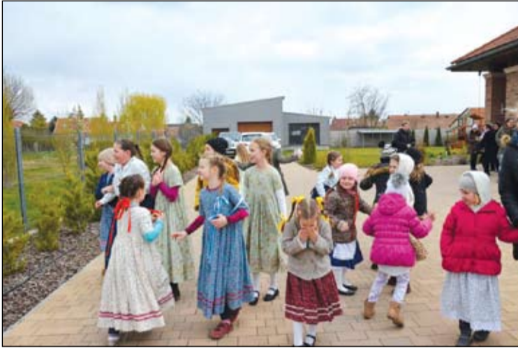
Az óvodás és kisiskolás táncos lányok Juhász Roziéknál várták az ünneplőbe öltözött legényeket

Képes beszámoló a Sárfehér Néptánc Egyesület Húsvéti locsolkodásáról