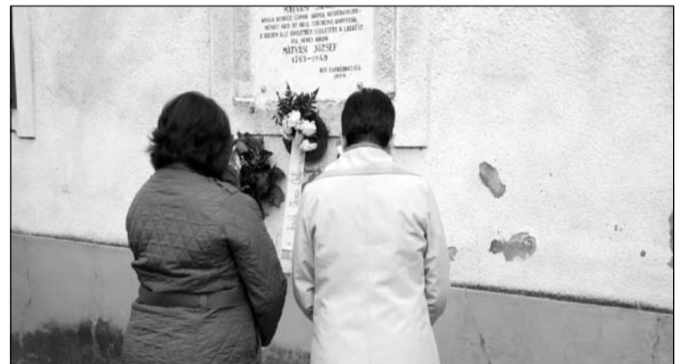
Koszorúzás a református parókia falán elhelyezett Mátyási-emléktáblánál