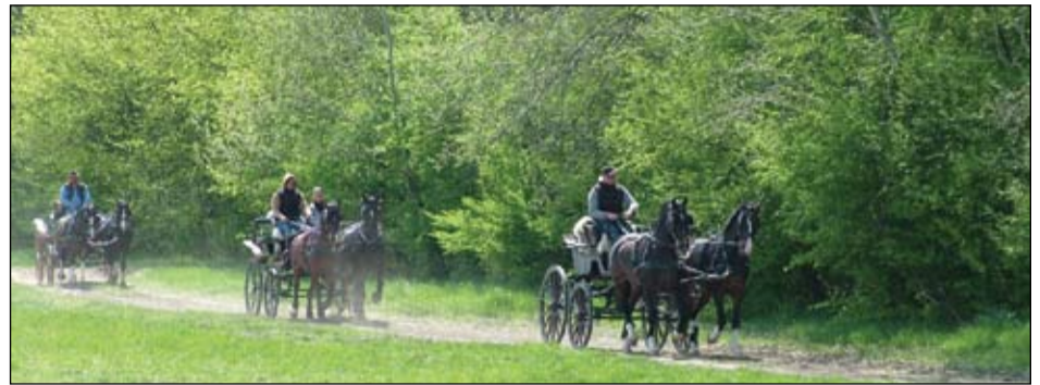
Gyönyörű izsáki környezet, gyönyörű lovak

Mint a 3. oldalon, a kettes vb. előkészületeiről szóló írásban is olvasható, Izsákon zajlott tíz napon át a kettes és négyes fogathajtók ez évi első Eb. és vb. felkészítő edzőtábor. A kettesek felkészülése egyben az április végén, május elején megrendezésre kerülő kettes szezonnyitó nemzeti bajnokságra való