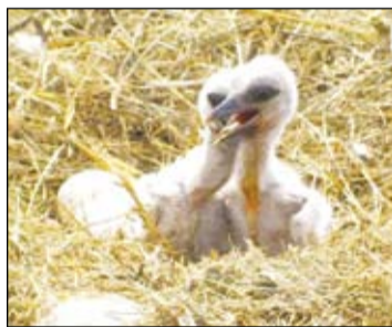
Fiatalkorú fehér gólyák

járják körül a Kolon-tavat, és végeznek gólyagyűrűzést a tavat körülvevő településeken (Izsák, Páhi, Csengőd-Kullér, Soltszentimre, Fülöpszállás, Kiszsák) gólyafészkeinél. Izsák belterületén idén csak négy pár gólya kezdett fészkelésbe! Az elmúlt években, márciusban sajnos több hagyományos gólyafészkek is hiába várta visszatérő lakóit. A