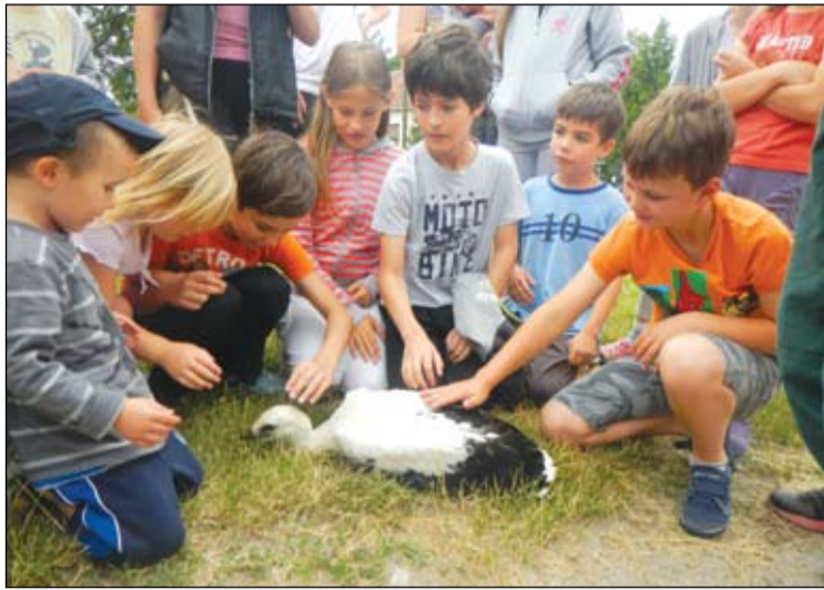
Gyerekek ismerkednek a gólyafiókával

A védelmi munkálatokkal párhuzamosan a gólyáink állományának és mozgásának nyomon követése is fontos feladat. A Kolon-tavi Madárvártán szakemberei idén június 27-én