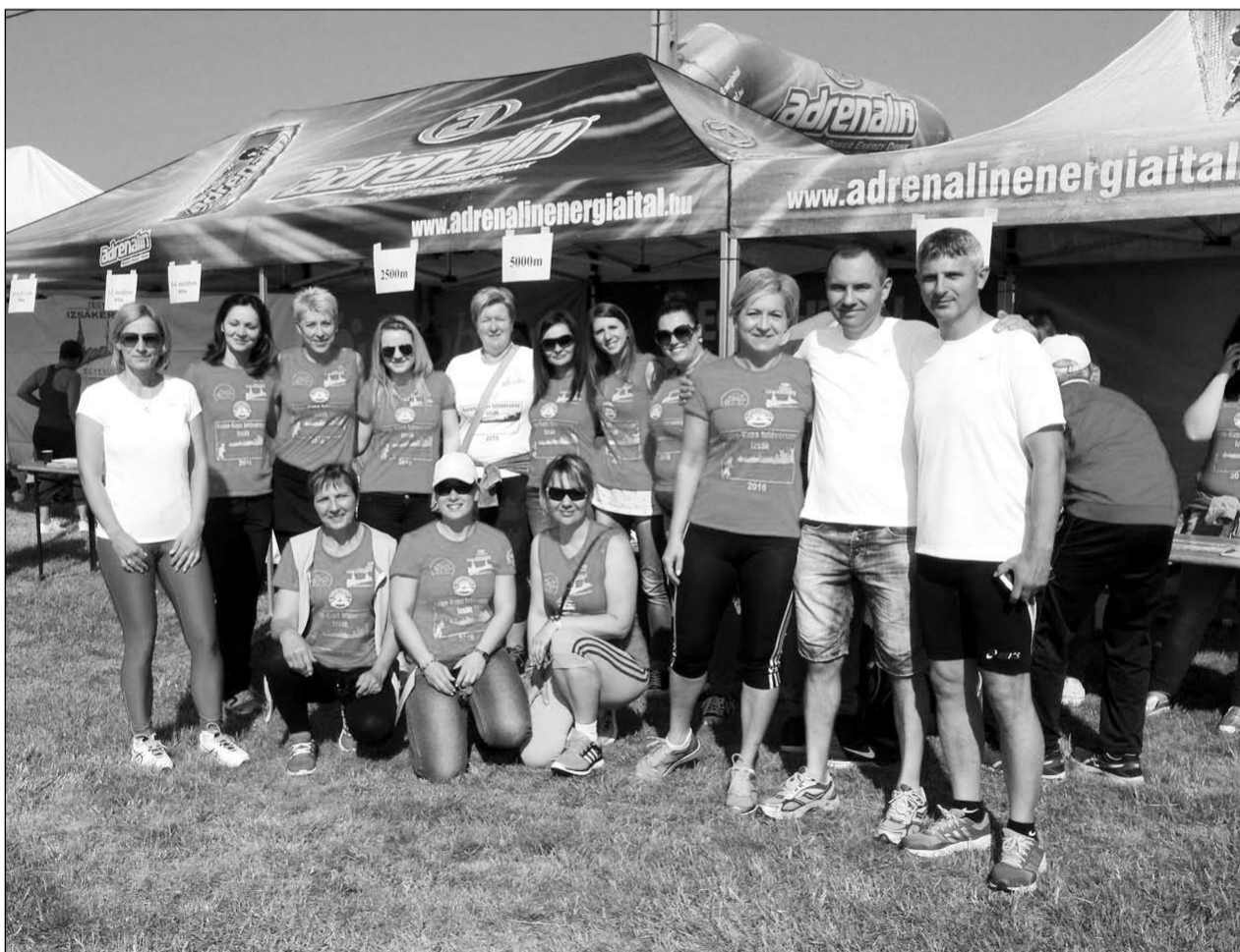
A IX. Kolon Kupa Futóverseny szervezői