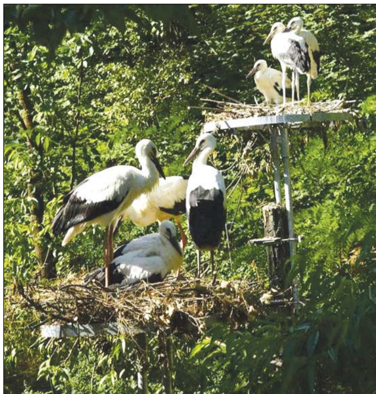
A Kolon-tav Madárvártán nevelkedő mentett gólyafiókák