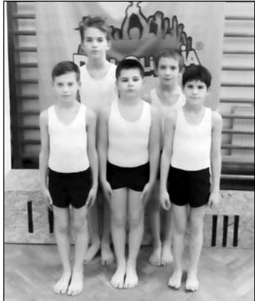
Diákolimpia II. korcsoportos fiú csapat