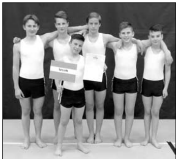
Diákolimpia III-IV. korcsoportos fiú csapat