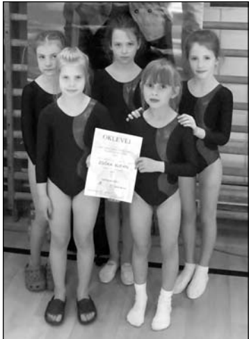
Zsóka Kupa I. korcsoportos lány csapat