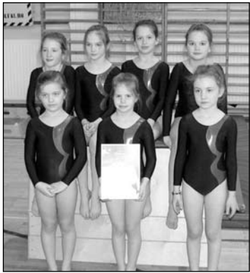
Diákolimpia I. korcsoportos lány csapat