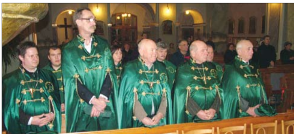
A szentelésen az Arany Sárfehér Bor- és Pezsgőrend tagjai rendi ruhájukban vettek részt