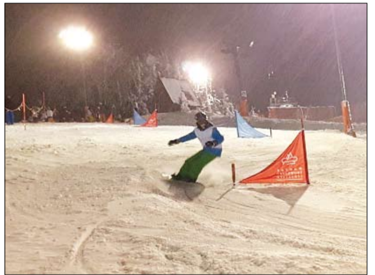
Marcell lesiklás közben

hogy zenei eredményt is ért el, hiszen Galántán egy hegedűversenyen bronzérmes lett. Azonban az igazi versenyzési hajlamát inkább a teniszben kamatoztatja. Idehaza 2014-ben és 2015-ben az ún. play