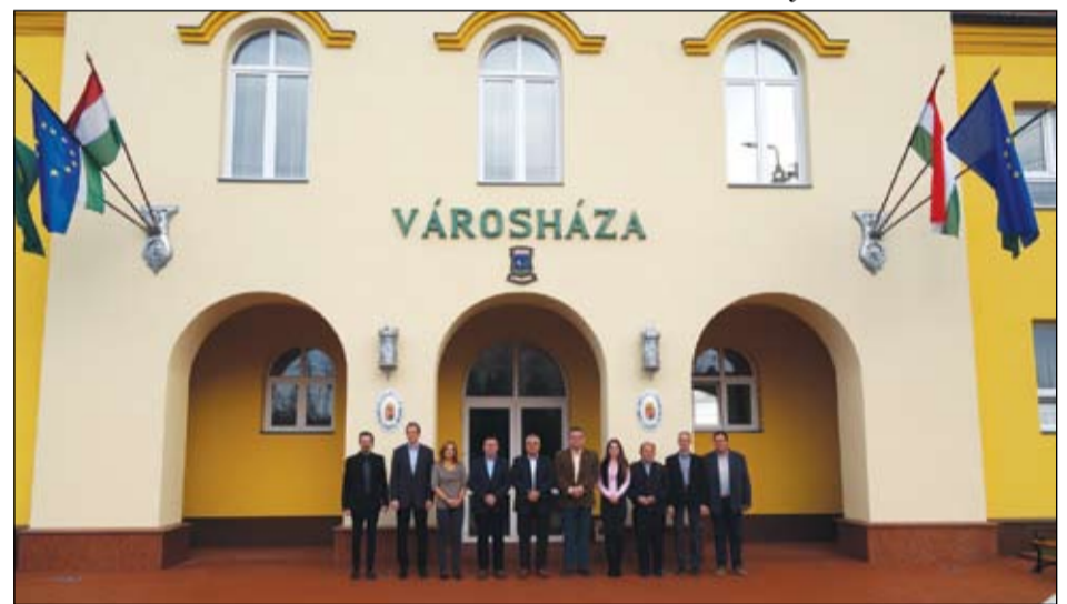
A Képviselő-testület tagjai a megújított városháza előtt