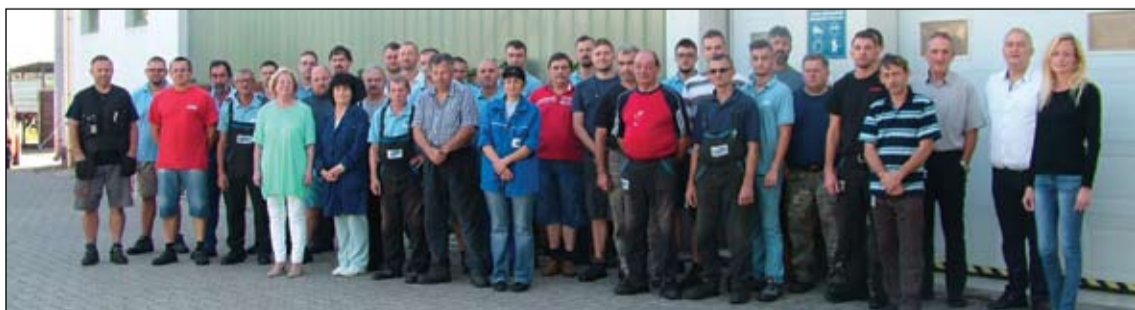
Együtt a jakabszállási részleg csapata

rendelkezésre állásbeli hiányosságokkal küzdő amatőr Izsaí Sárfehér SE felnőtt és ifi csapata, a mérkőzéseken nyújtott hozzáállása alapján, a várakozásoknak megfelelően hozta az őszi idényt. -fg-