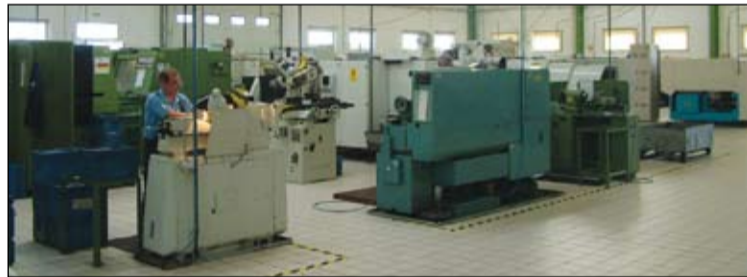
A legkorszerűbb, számítógépes vezérlésű gépeken dolgoznak a cég munkatársai

ipar összevonásával megalapította a mai Borela Bt.-t, amelyben nagyobb volumenű motorikus alkatrész gyártást végeztek. A 90-es céglapítás után, 1995-ben egy fontos állomáshoz érkezett a vállalkozás. Fülöpszálláson új telephelyet vásároltak, s ott egy nálunk akkor még teljesen új technikával, kardánvilla megmunkálásba és dugattyú- gyártásba kezdtek CNC esztergapadokon. Ez a lépés tulajdonképpen kijelölte, pontosabban megerősítette a jövő útját, hiszen ezen technológia mentén haladva döntöttek úgy 2001-ben, hogy egy Jakabszálláson akkor eladóvá vált 500 négyzetméteres üzemcsarnokkal rendelkező forgácsoló üzemet megvásárolnak, s az ott folyó tevékenységet folytatják, illetve továbbfejlesztik. Utóbbi szándék feltételeinek megteremtésére 2009-ben egy tízezer négyzetméteres, majd 2015-ban további harmincezer négyzetméteres ipari területet vásároltak meg a jakabszállási üzem mellett,